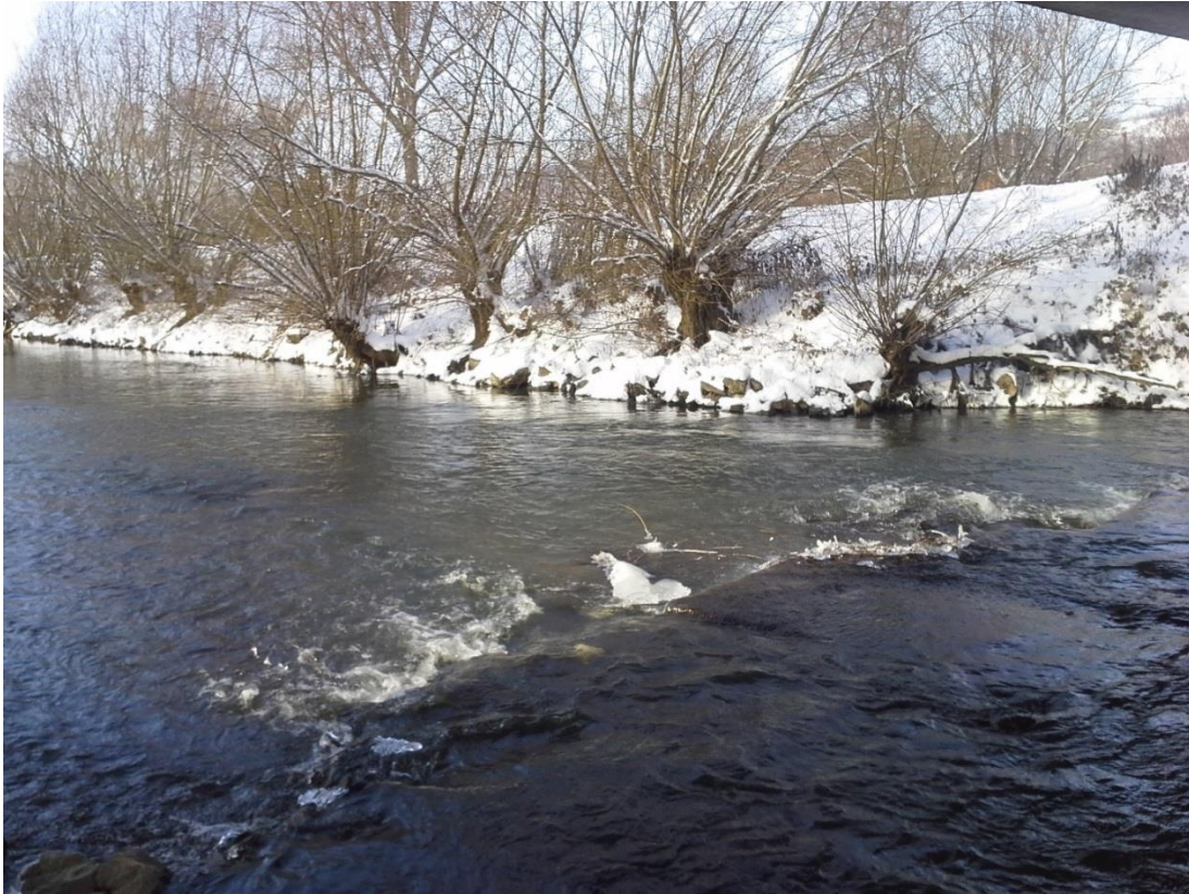
Host'ovce, tok Bodva (17.1.2017)