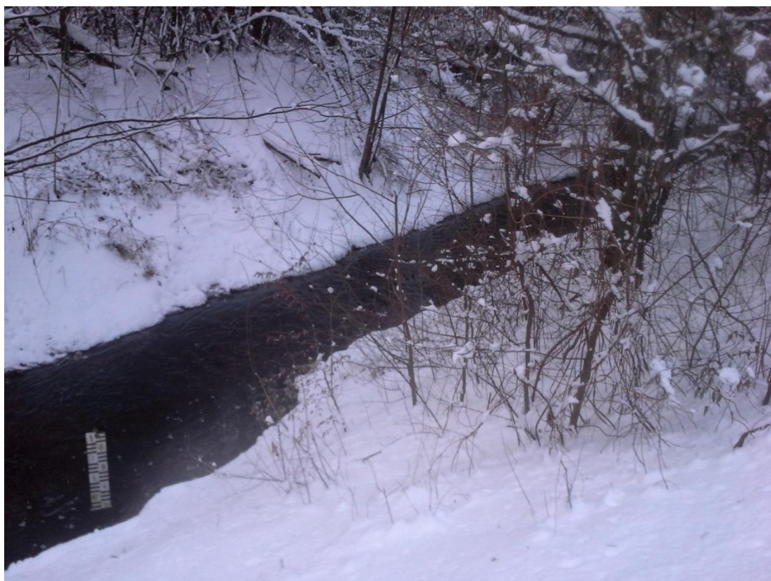
Bukovec II. , tok Ida (17.1.2017) priebeh vodnej hladiny pod vodným dielom je voľný a bez ľadových úkazov ako dôsledok vypúšťania teplejšej vody zo spodných vrstiev nádrže