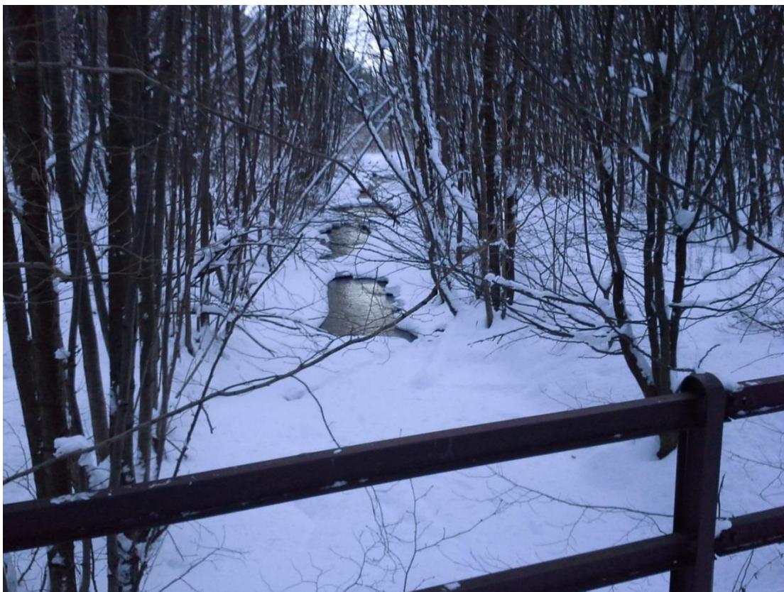
Hýľov, tok Ida (17.1.2017) ľadový úkaz – ľad pri brehu až zámraz vodnej hladiny