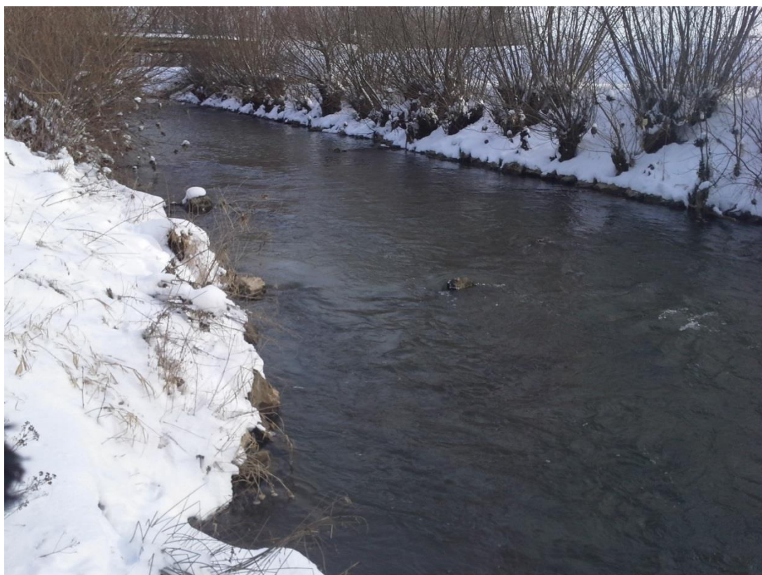
Turňa nad Bodvou, tok Bodva (17.1.2017) daným profilom tečú aj vody z krasových oblastí s vyššou teplotou, priebeh vodnej hladiny je voľný a bez ľadových úkazov