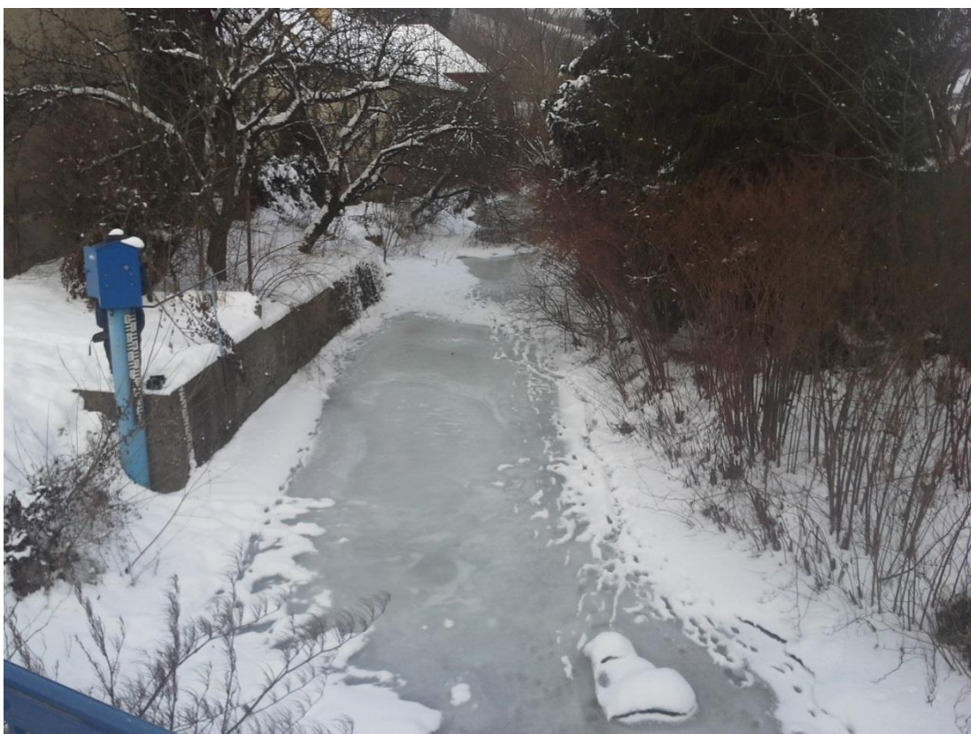
Medzev, tok Bodva (17.1.2017) ľadový úkaz – úplný zámraz toku, vzdušná vodnej hladiny