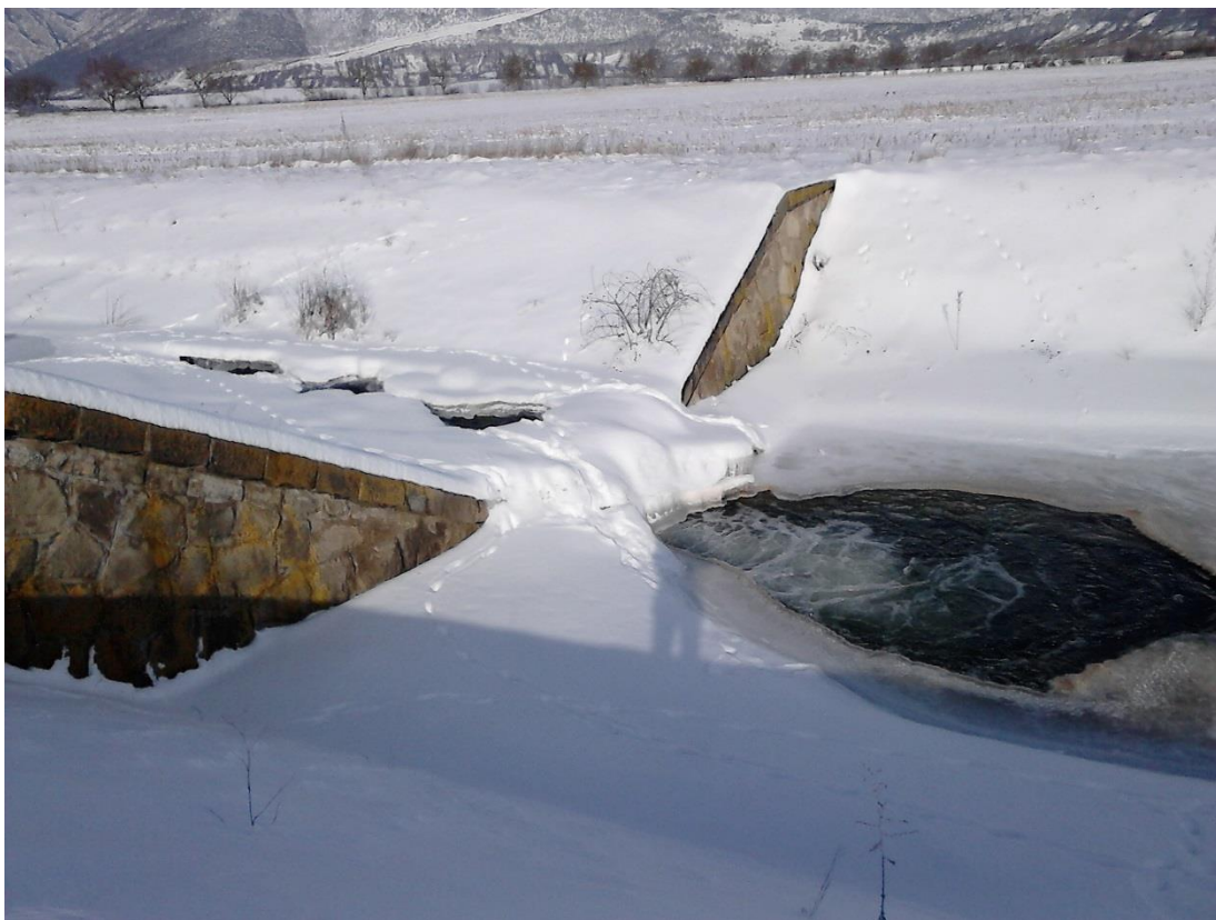
Host'ovce, tok Turňa (17.1.2017) ) ľadový úkaz – zámrz toku, vzduť vodnej hladiny