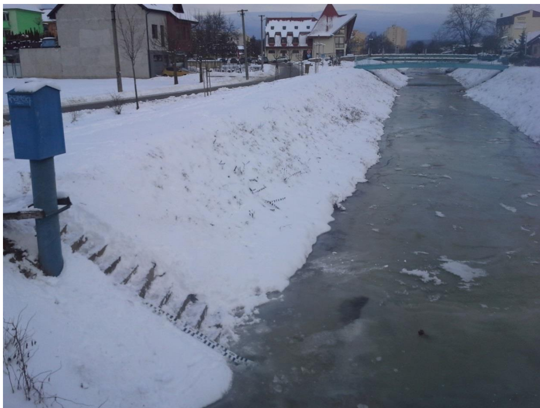
Moldava nad Bodvou, tok Bodva (17.1.2017) ľadový úkaz – úplný zámraz toku, vzdušie vodnej hladiny