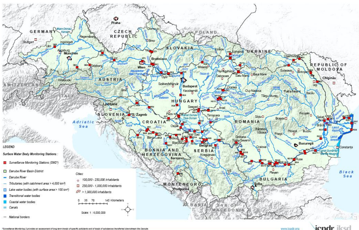
Obr. 2 Medzinárodná monitorovacia sieť TNMN

K implementácii požiadaviek ICPDR výrazne prispieva medzinárodná pozorovacia sieť (TNMN) pre pozorovanie vývoja kvality Dunaja, ktorá je v prevádzke od roku 1994. Pravidelné monitorovanie kvality vody celého Dunaja má poskytnúť celkový vyvážený pohľad na jeho znečistenie, dlhodobé trendy vývoja kvality vody a výpočet zaťaženia znečistením. Do tohto monitoringu je od jeho začiatku zapojená aj Slovenská republika.