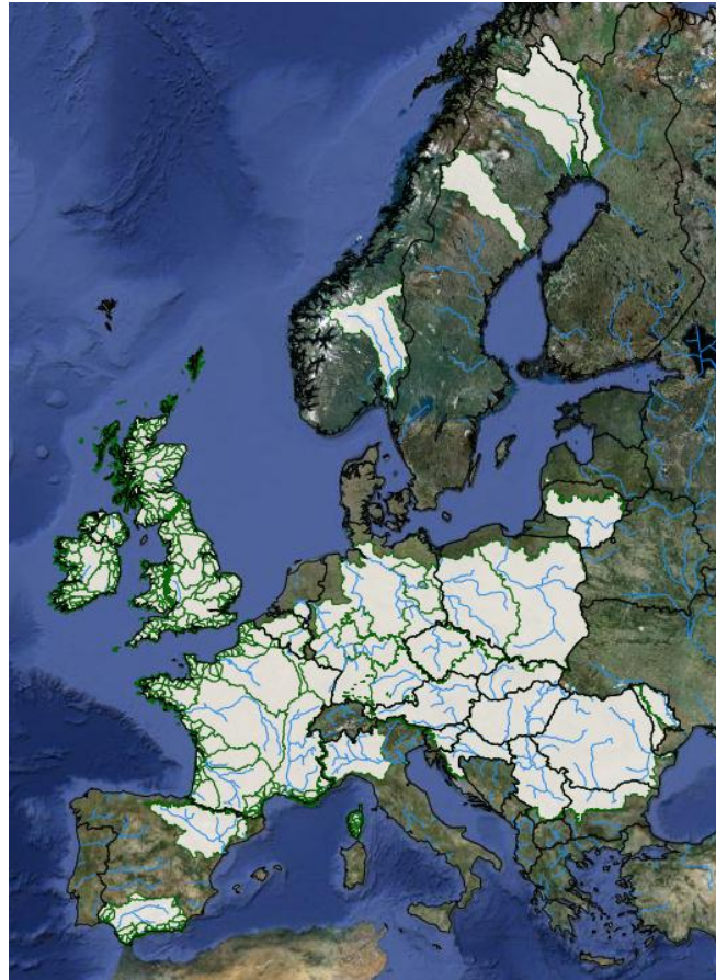
Obr. 3 Povodia, pre ktoré EFAS vysiela výstrahy

Výstrahy (Flood Alert Report a Flood Watch Report) sú určené pre Monitorovacie a informačné centrum a pre národné hydrologické služby, aby sa mohli včas prijať potrebné opatrenia na ochranu pred povodňami. Výstrahy sa vydávajú s predstihom 3-10 dní.