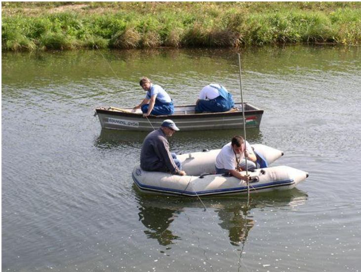
Obr. 4 Spoločné SK-HU hydrometrovanie (priesakový kanál)

V rámci plnení požiadaviek jednotlivých Komisií hraničných vôd ústav začlenil do Programu monitorovania aj monitorovanie v bilaterálne dohodnutých profiloch na hraničných tokoch. Každoročne sa vykoná cca 120 spoločných hydrometrovaní, vymieňajú a odsúhlasujú sa monitorované hydrologické údaje, od roku 2007 sa v česko-slovenskom cezhraničnom útvare podzemných vôd spoločne pozoruje jeho kvalita.