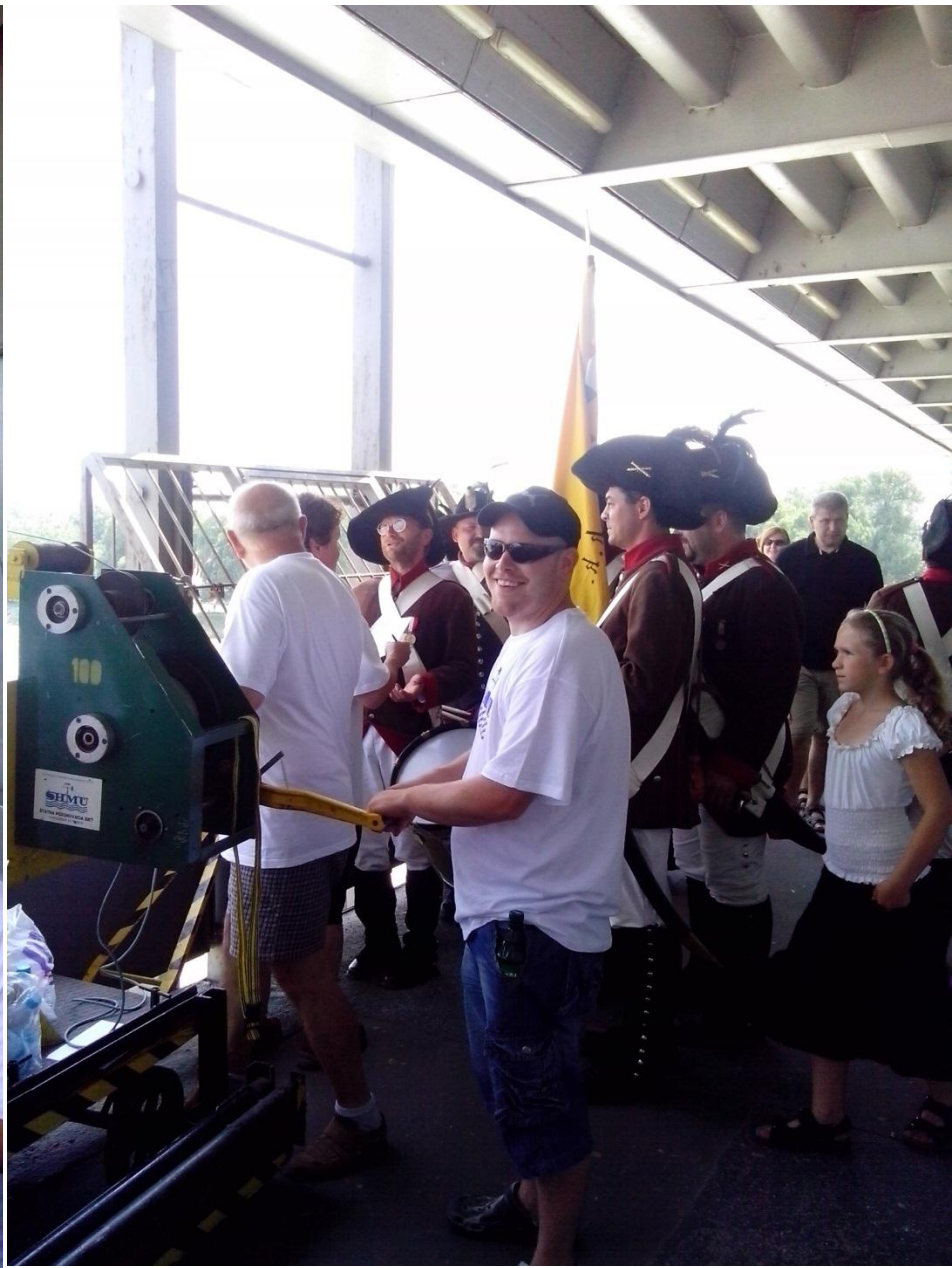
A posily aj naozaj prišli....