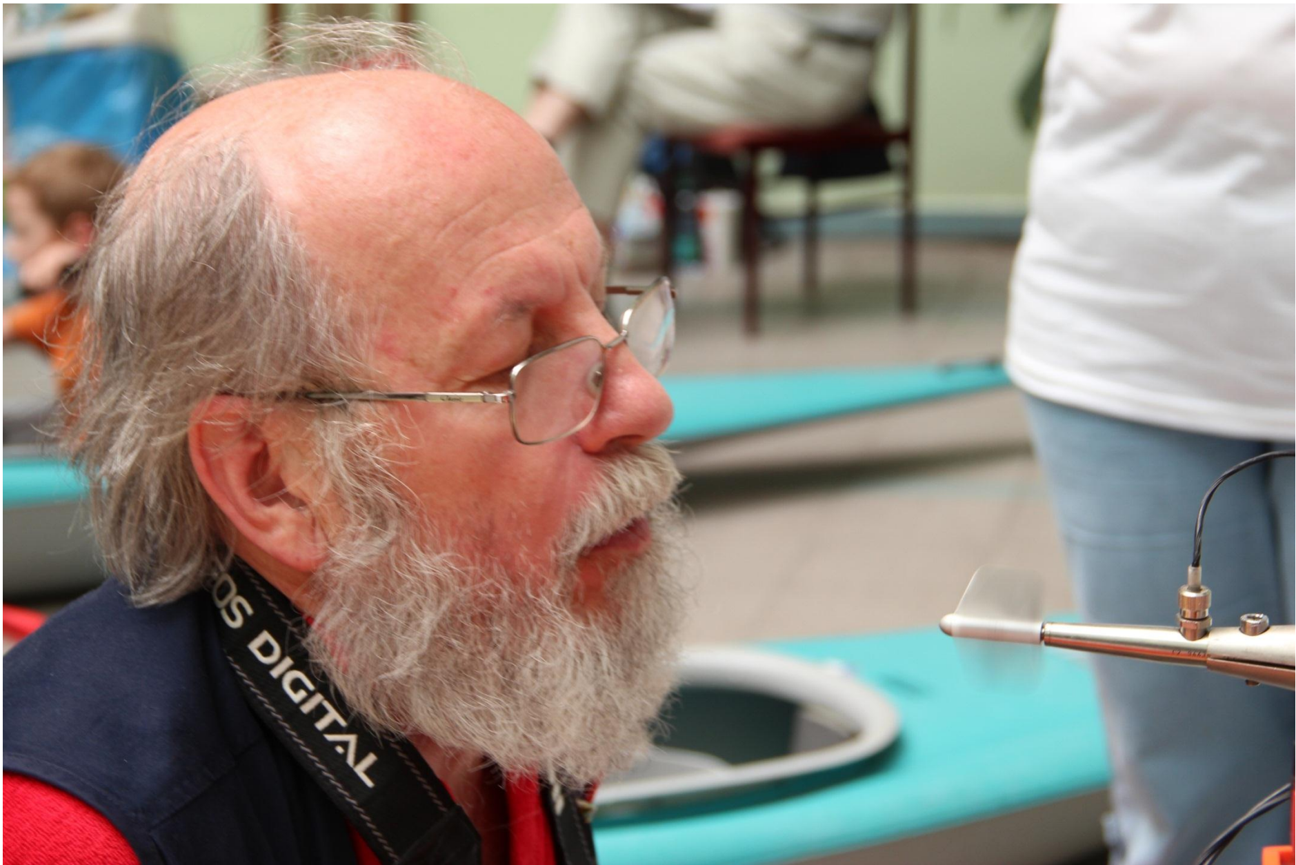
Najstarší účastník našej súťaže