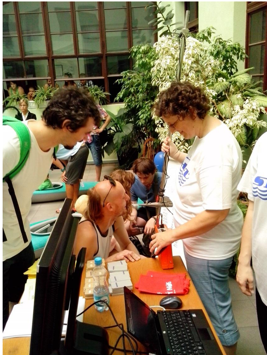
Ale i dospelí...