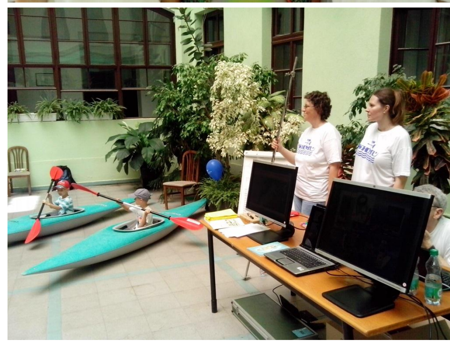
Fúkal dokonca aj strážca Dunaja