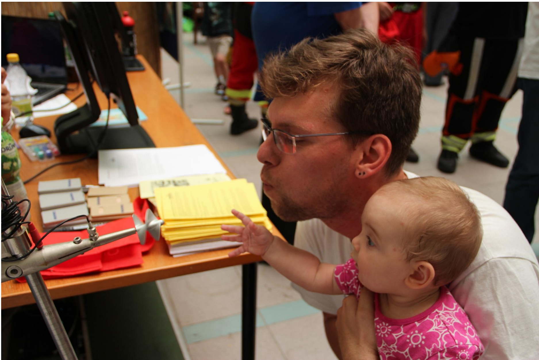
Najmladšia účastníčka našej súťaže